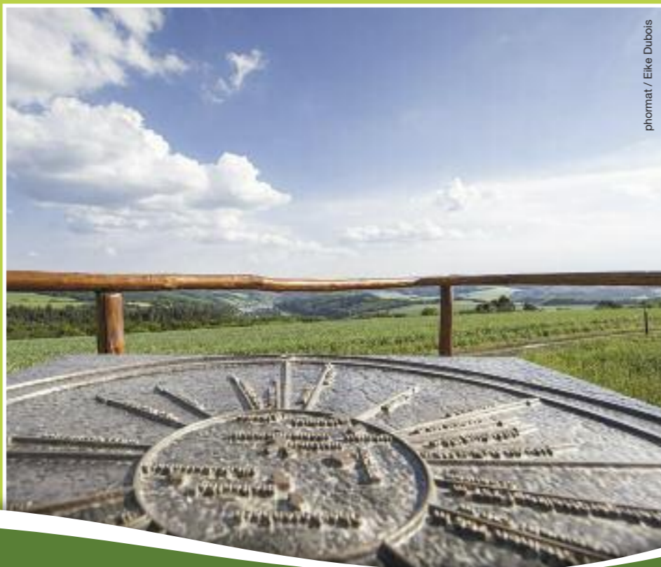
phormat / Elke Dubois