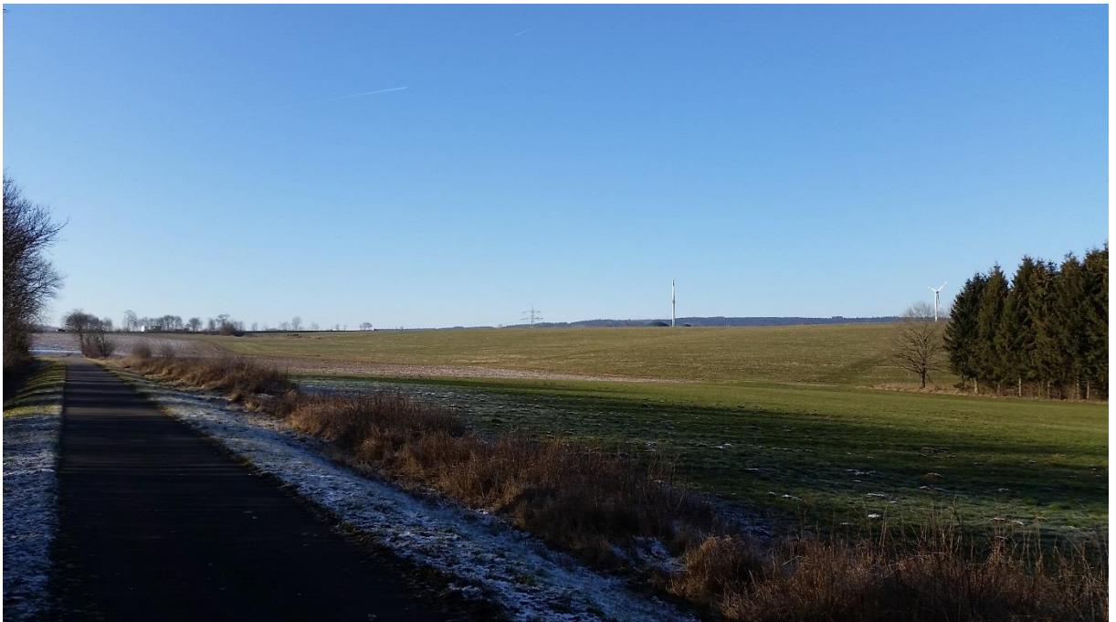
Abb. 4: Blick vom Ruwer-Radweg auf das Plangebiet - 21.01.2019.

Im Nordwesten ergeben sich weitreichende Sichtbeziehungen nach Südosten über das Plangebiet und das Tal des Staffelbornbaches hinweg auf die bewaldeten Kuppen des Hochwaldes.