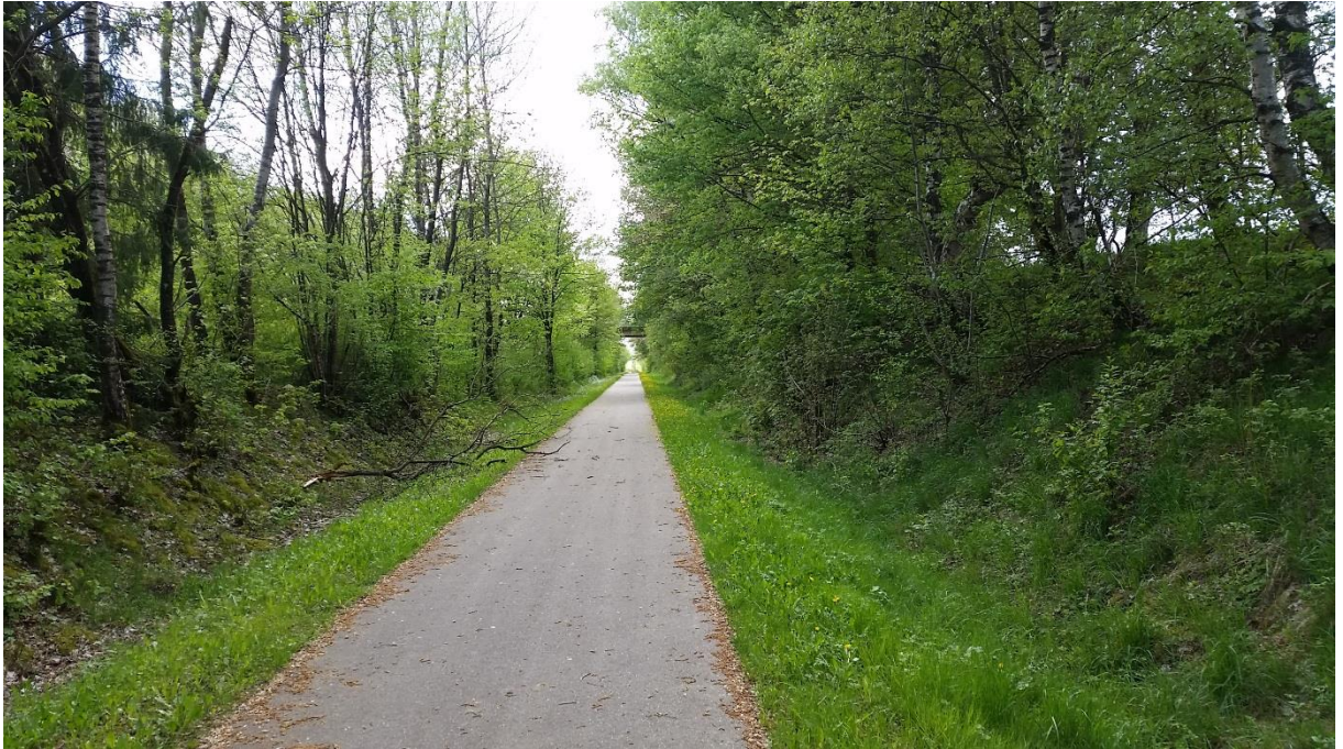
Abb. 3: Gehölzstreifen beiderseits des Radweges südlich des Plangebietes.

In Abhängigkeit von der Exposition sind an den Rändern verschiedene Vertreter der frischen [u. a. Alliaria petiolata (Knoblauchsrauke), Glechoma hederacea (Gundermann), Urtica dioica (Brennnessel), Senecio ovatus (Fuchs-Greiskraut), Cardamine pratensis (Wiesen-Schaumkraut)] und trockenen Säume [u. a. Daucus carota (Wilde Möhre), Agrimonia eupatoria (Kleiner Odermennig), Hypericum perforatum (Geflecktes Johanniskraut)] sowie weitverbreitete Gräser wie Arrhenatherum elatius (Glatthafer), Dactylis glomerata (Wiesen-Knaulgras), Festuca rubra agg. (Rotschwengel) vertreten.