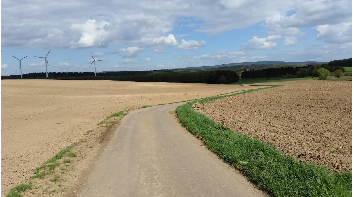
Abb. 2: Das Plangebiet bestimmende Intensiväcker.