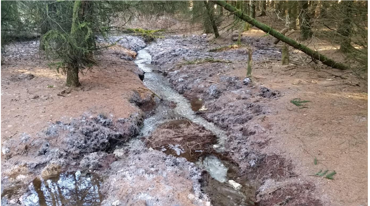
Abb. 1: Graben zum Staffelbornbach 100 m östlich der Einleitstelle - 21.01.2019.